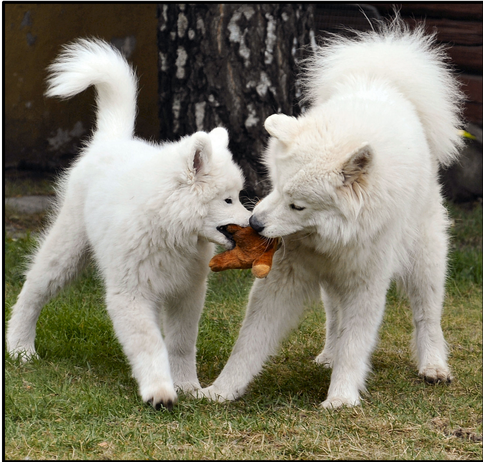
Det naturliga valet för den aktiva och friluftsinresserade valpköparen.

Här besvaras några vanliga ställda frågor kring rasen. /SPHK: s rasklubb för samojedhund 2013. Senast uppdaterad december 2015.